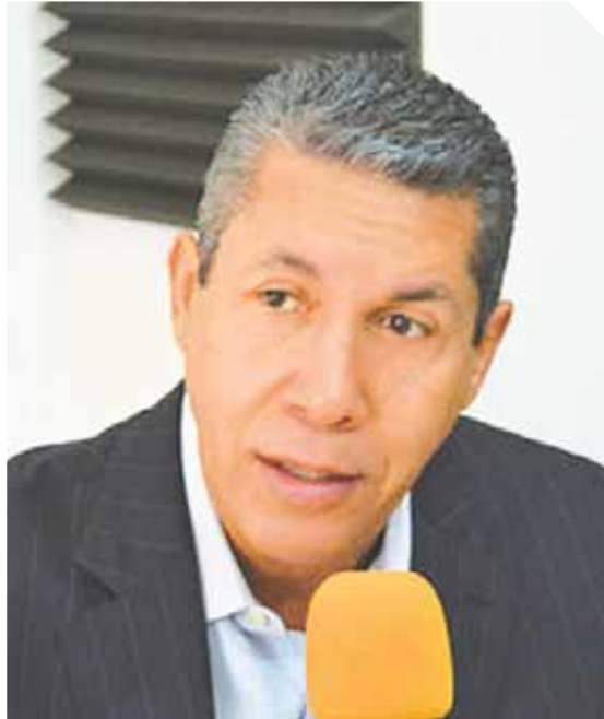
Henry Falcón informó sobre conversaciones con el nuncio apostólico Aldo Giordano en donde planteó la propuesta de las elecciones presidenciales.

Falcón pidió a los dirigentes no engañar al pueblo con posibles soluciones luego del 11-N pues a su juicio hay muchos problemas que no se resolverán en una semana, por eso se debe ser concreto y eficaz, para así darle confianza a los venezolanos. Insistió en que el inmediatismo de resolver las