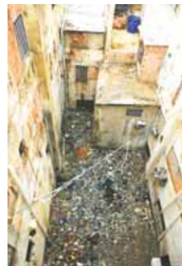
En medio de los dos edificios hay un vertedero de basura improvisado.

“El Hospital de La Paz” se construyó en 1988, y una vez que estaba casi listo para abrir sus puertas, el Banco Hipotecario del Zulia ejecutó el centro por deudas millonarias que los dueños no habrían saldado, relató Fernández. Cinco años después fue inaugurado como “Villa Amada” y se convirtió