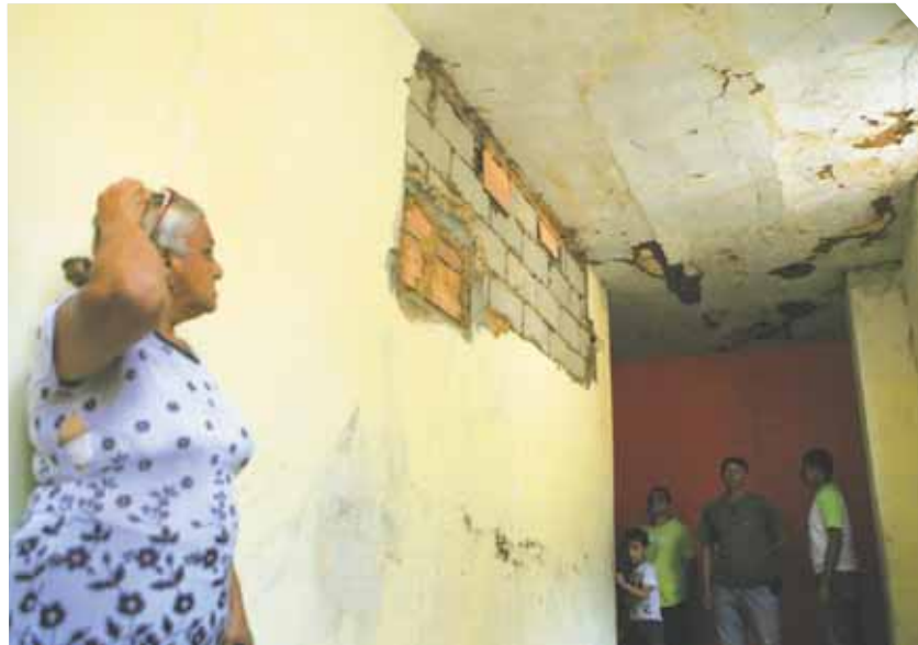
El techo del último piso del edificio comenzó a caerse tras la vaguada que cubrió a Maracaibo el pasado lunes.

En medio de las dos estructuras funciona una especie de vertedero de basura, toda clase de desechos han ido acumulándose de tal manera, que los malos olores se impregnan hasta el último rincón de “El Hospitalito”.