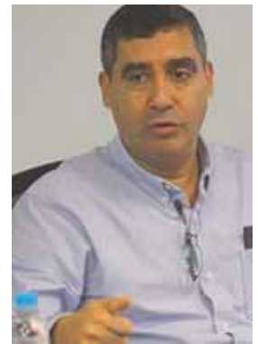
Advirtió que negarse a conversar es abrir "los cauces de la violencia".

Por último, Torres indicó que ninguna de las fuerzas política está en la capacidad de imponerse, por lo tanto aseguró que la mesa de negociación se presenta como la mejor opción para dirimir las diferencias.