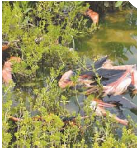
Los investigadores de la Universidad del Zulia informaron que cerca de los restos había polluelos.

► José Flores Castellano | jflores@versionfinal.com.ve