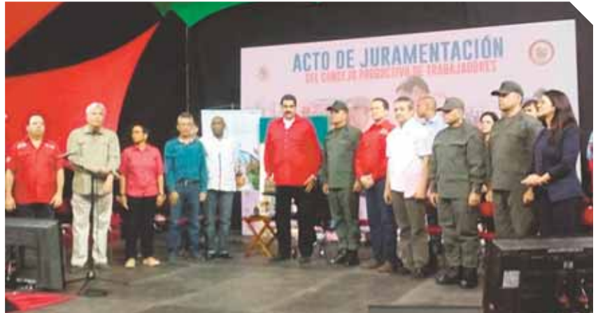
El Presidente de la República juramentó y activó 800 Consejos Productivos de Trabajadores.

"Todas las empresas públicas, a ponerse los patines. Yo pido el apoyo de la clase obrera para llevar a cabo este plan porque hay mucho tecnócrata robando al pueblo y conspirando con la derecha (...) Yo sé de varios que andan conspirando con la embajada gringa para sabotear servicios y empresas", dijo el mandatario.