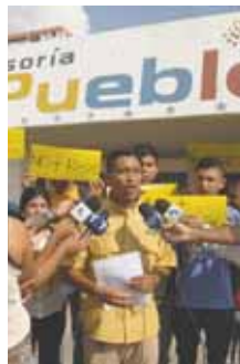
Entregaron un documento en la Defensoría del Pueblo.

Sentenció que mientras no se le garanticen los derechos humanos a los jóvenes