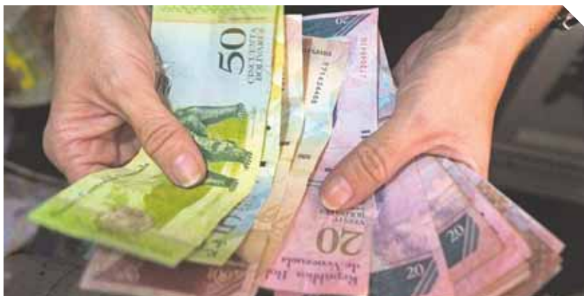
Según manifestó el presidente del BCV aún no se han realizado los respectivos diseños para el papel moneda.

pesar del panorama negativo, sobre la pronta recuperación de la economía nacional.