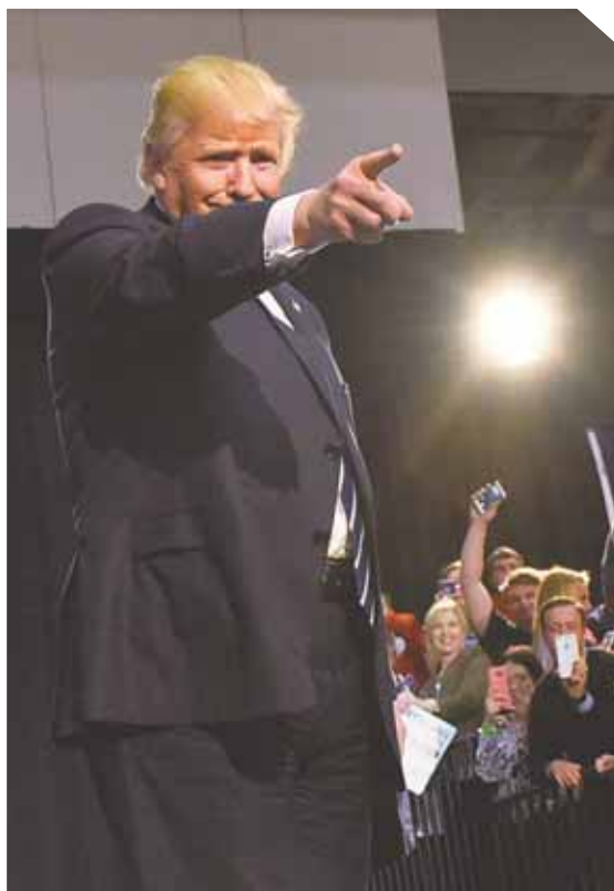
Donald Trump, de 70 años, ganó las elecciones presidenciales de Estados Unidos.

Aproximadamente 47 millones de estadounidenses ya habían votado antes de las elecciones. El histórico duelo mantuvo en vilo al mundo