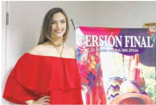
La exreina de belleza Yosy Finol comparte los secretos de la comida saludable.