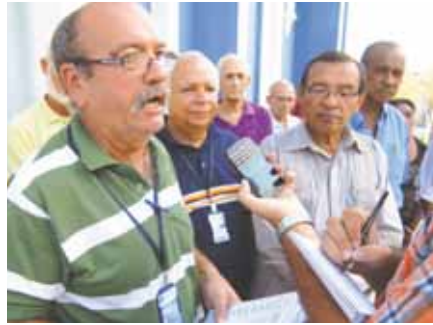
Jubilados aseguran que tienen problemas con el Seguro Social.

"Le llevamos un oficio al CLEZ que luego fue redirigido al departamento de Desarrollo Social, cuando lo único que le pedíamos es que interviniera ante el problema", mencionó.