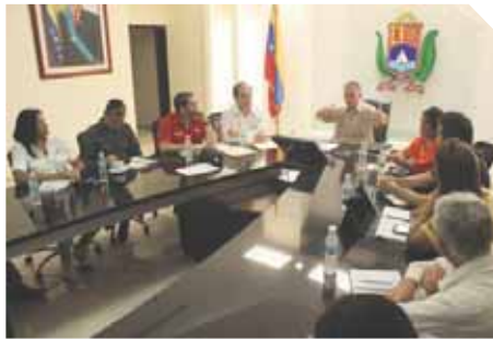
El encuentro se realizó en la residencia del Gobernador.

Arias Cárdenas presentó los planes en las áreas de mineras mecánicas, como el granito y la sal que forman parte del programa de crecimiento de