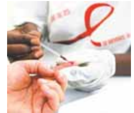
Sin los medicamentos, los pacientes están en peligro de muerte.