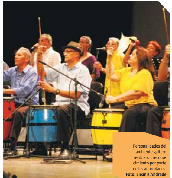
Personalidades del ambiente gaitero recibieron reconocimiento por parte de las autoridades.