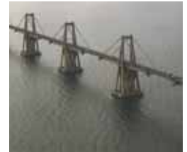
Hasta altas horas de la noche realizaron la búsqueda del cuerpo.