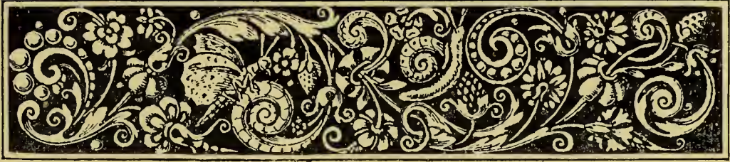
TABLE DES NOMS DES ARTISTES ET DES FOURNISSEURS D'OBJETS D'ART